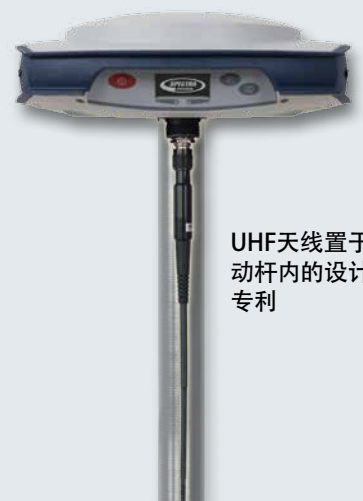
UHF天线置于流动杆内的设计专利